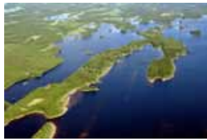
Skeppsvik är landets mest utpräglade drumlinskärgård. Långsträckta nord-sydliga moränryggar finns både över och strax under ytan.