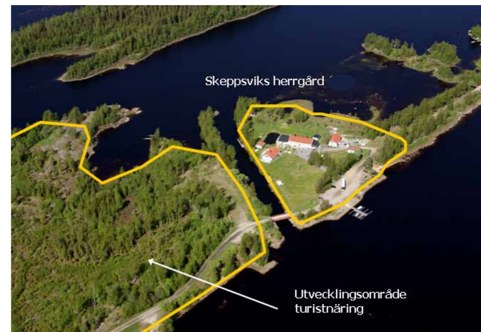
Skeppsvik- ett område med potential att utvecklas för turism- och besöksnäring