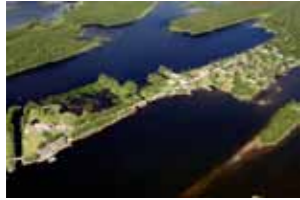
Skeppsviks herrgård, till vänster i bild, är det främsta utvecklingsområdet för besöksnäring utmed den norra kuststräckan. Till höger i bild syns Skeppsviks samhälle