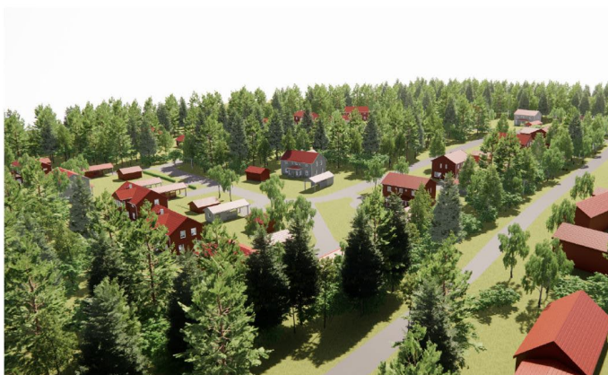
Illustrationer över exempelbebyggelse för olika delar inom planområdet.