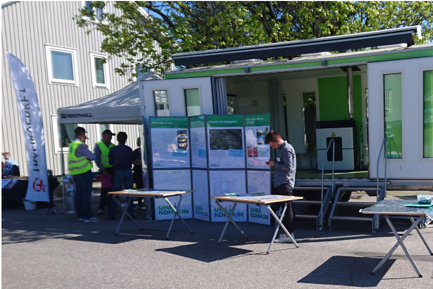
Umeå kommuns montervagn med trafikverket till vänster.

Söndagen den 29 maj bjöd Umeå kommun in till ett drop-in möte inom ramen för arbetet med den fördjupade översiktsplanen för Sävar. Mötet hölls i Sävar på Sävar marknad kl. 11-16:00, där kommunen hade monterplats med stor vagn och tält. Kommunen hade även bjudit in Trafikverket att delta på mötet och de hade två representanter på plats i kommunens monter.