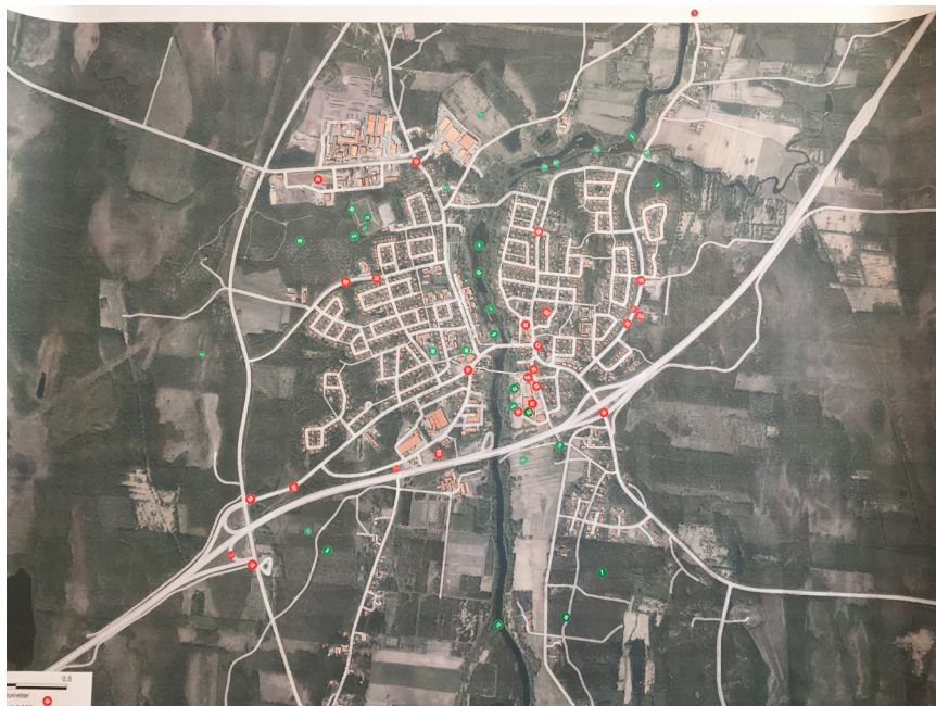
Kartan där bra platser respektive problematiska platser markerades

På översiktskartorna hade besökarna möjlighet att märka ut bra och dåliga platser i Sävar och diskutera med kommunens representanter utifrån en bestämd geografi. De många frågorna om Norrbotniabanan hänvisades framförallt till Trafikverkets representanter. Det var även många som hade frågor och synpunkter om den nyligen antagna detaljplanen för Sävar centrum. Detaljplanen är inte en del av det fördjupade översiktsplanearbetet för Sävar, men diskussionen kring detaljplanen var en bra ingång till diskussion om översiktsplanefrågor för Sävar.