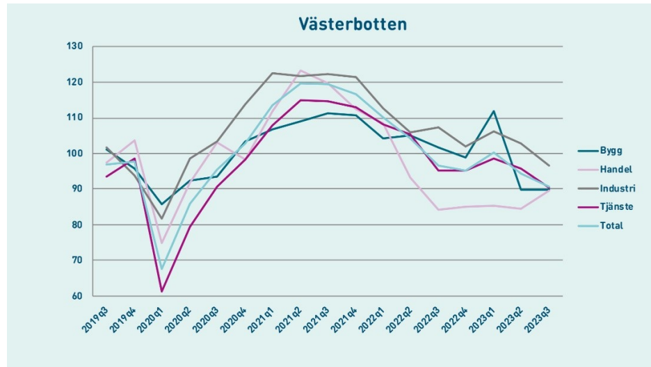
Figur 1. Konfidensindikatorn tas fram genom en företagsenkät och mäter nuläget i näringslivet samt hur företagen ser på den närmaste framtiden (källa Norrlandsfondens konjunkturbarometer 2023 )