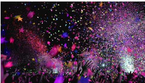
En fullmatad höst på Väven!

- En chans att förkovra sig i väldigt bra och lokal kultur innan det är dags att möta upp vänner, släkt och bekanta för att skåla in det nya året.