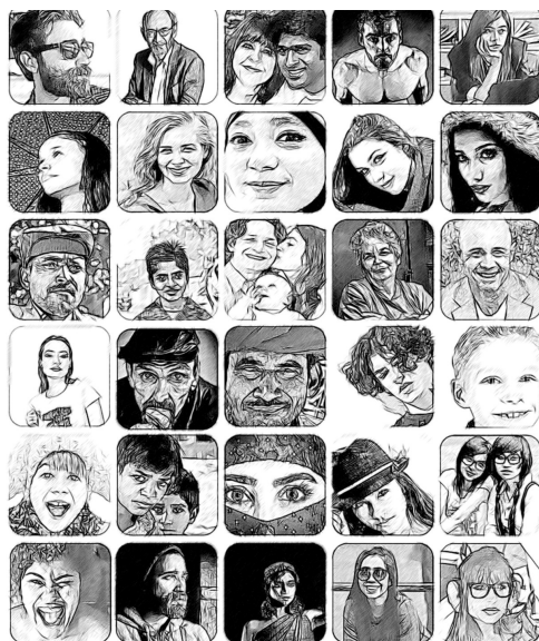
Illustration: Vasaplans vänner

Gör som kulturföreningen Vasaplan; sök ekonomiskt stöd till din förening för projekt som firar Umeå 400 år!