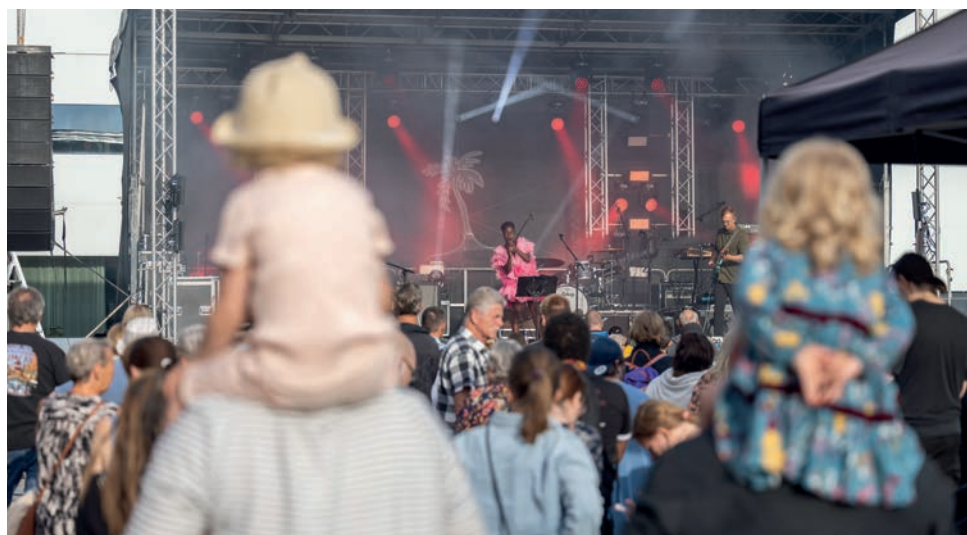
Umeå Live 400 år var ett arrangemang för alla generationer.