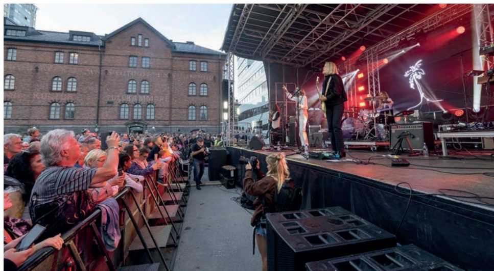
Fullt av publik framför scenen i det otroliga vädret.