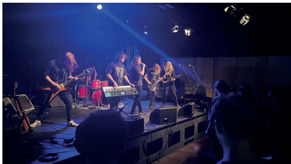
Ung scen där unga musiker och artister fick möjlighet att stå på en publik scen och spela sin musik.