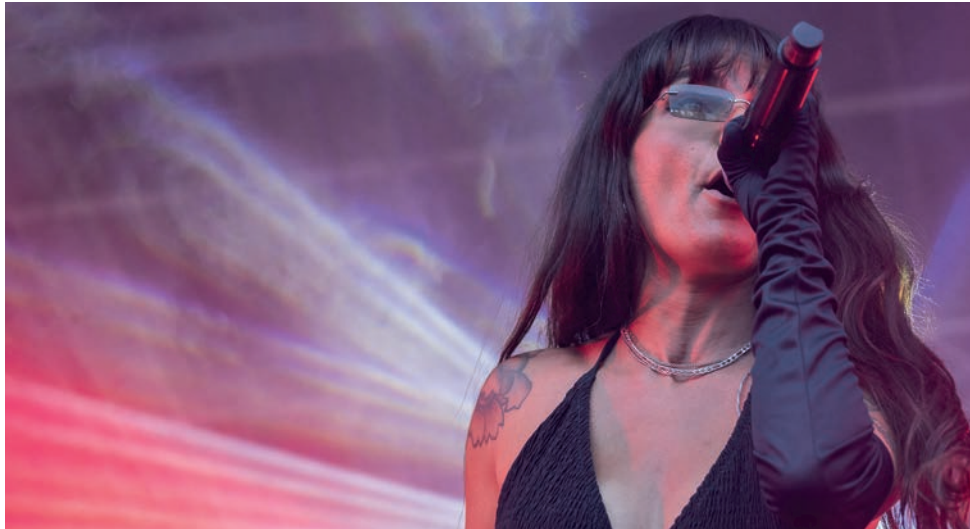
En auktoritet och kraft inom svensk hiphop, Nathalie "Cleo" Missaoui, på scen.