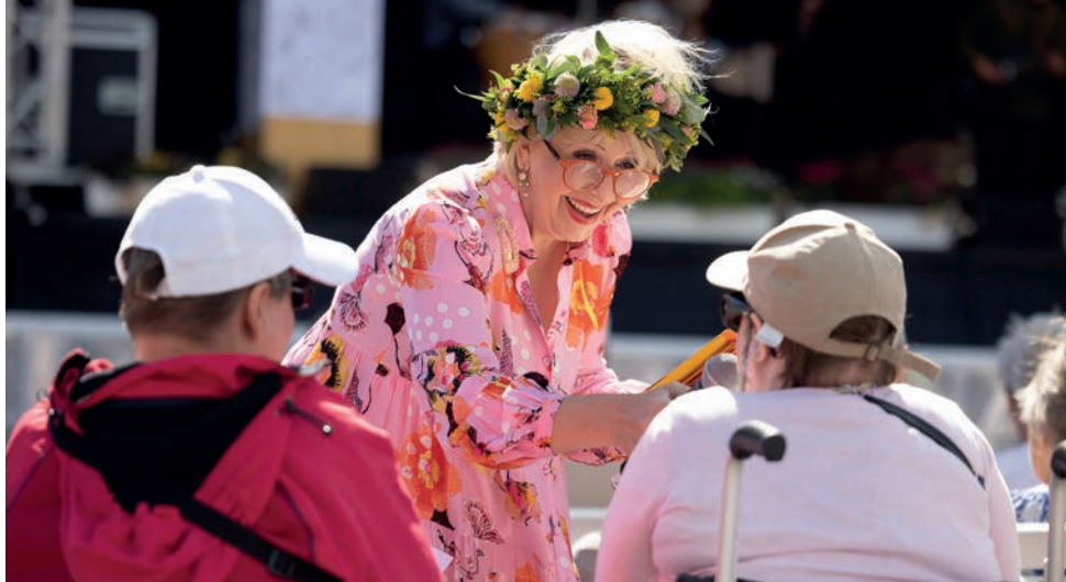
Allsång under ledning av folkkära skådespelaren och komikern Pia Johansson på Rådhusorget under dagen.