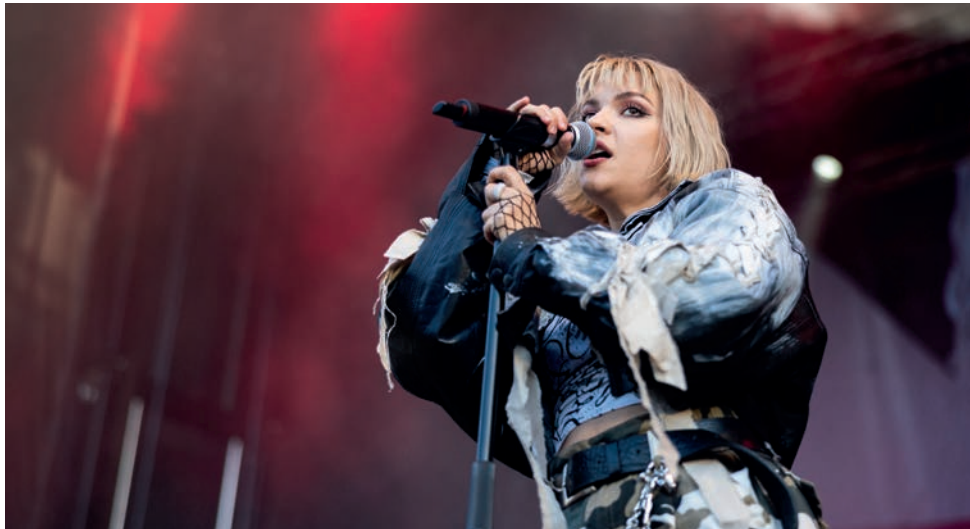
Umeås egen världsstjärna Tove Styrke avslutade Jubileumsdagen.