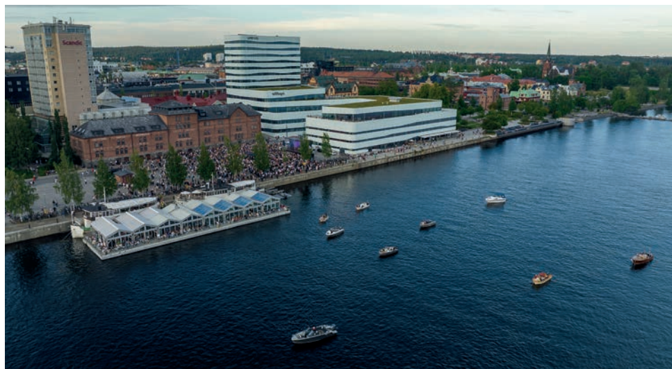
Vissa tog båten för att lyssna på musiken.