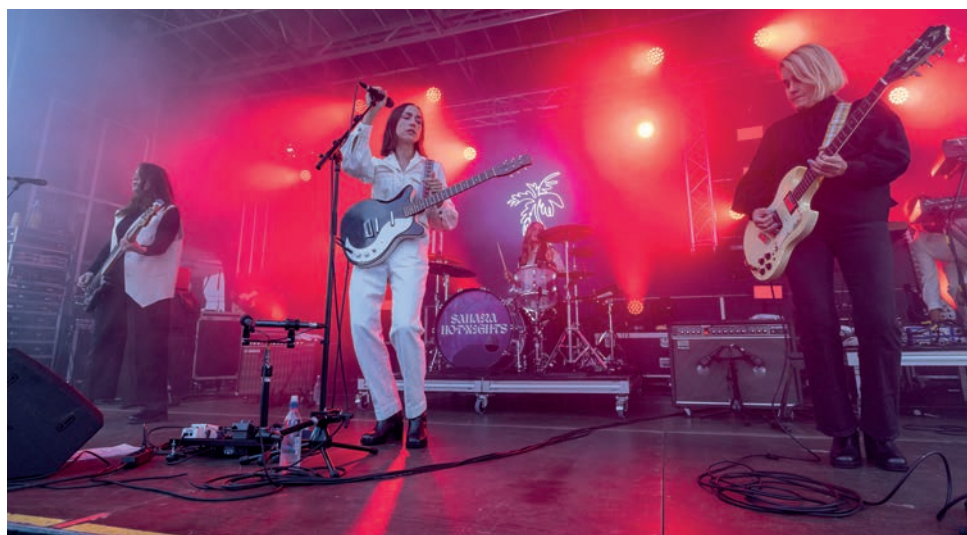
Sahara Hotnights inledde sin återkomstturne på Umeå Live 400 år.