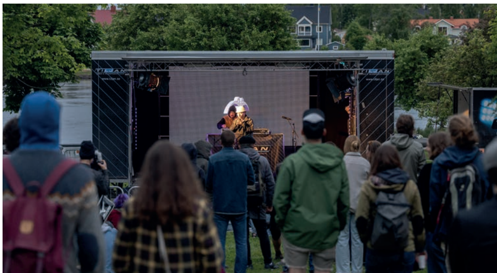
Bland annat uppträdde Gonza-Ra på lilla scenen i Rådhusparken.