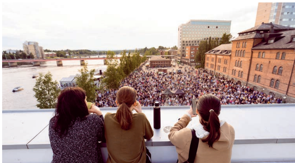
Publiken är redo för kvällens artister nere på Skeppsbron vid älven.