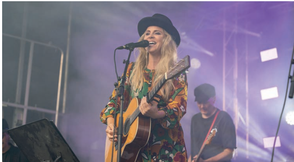
Folkkära artisten Lisa Miskovsky med band uppträdde och underhöll.