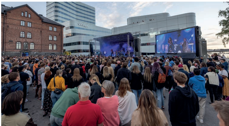
En storbildsskärm gjorde att alla kunde se uppträdanden.